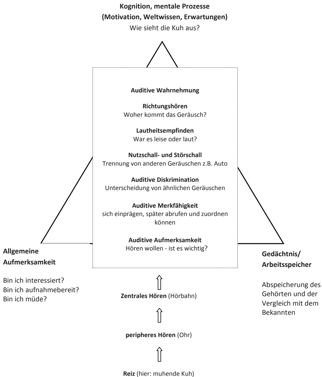
Abb. in Anlehnung an: Lupberger, N.: Auditive Verarbeitungs- und Wahrnehmungsstörung im Kindesalter. Seite 21)

Was sich in Ihrem Kopf abspielt, wenn Sie an einer Kuhweide vorbei gehen und plötzlich ein „Muh“ hören, könnte wie folgt aussehen: